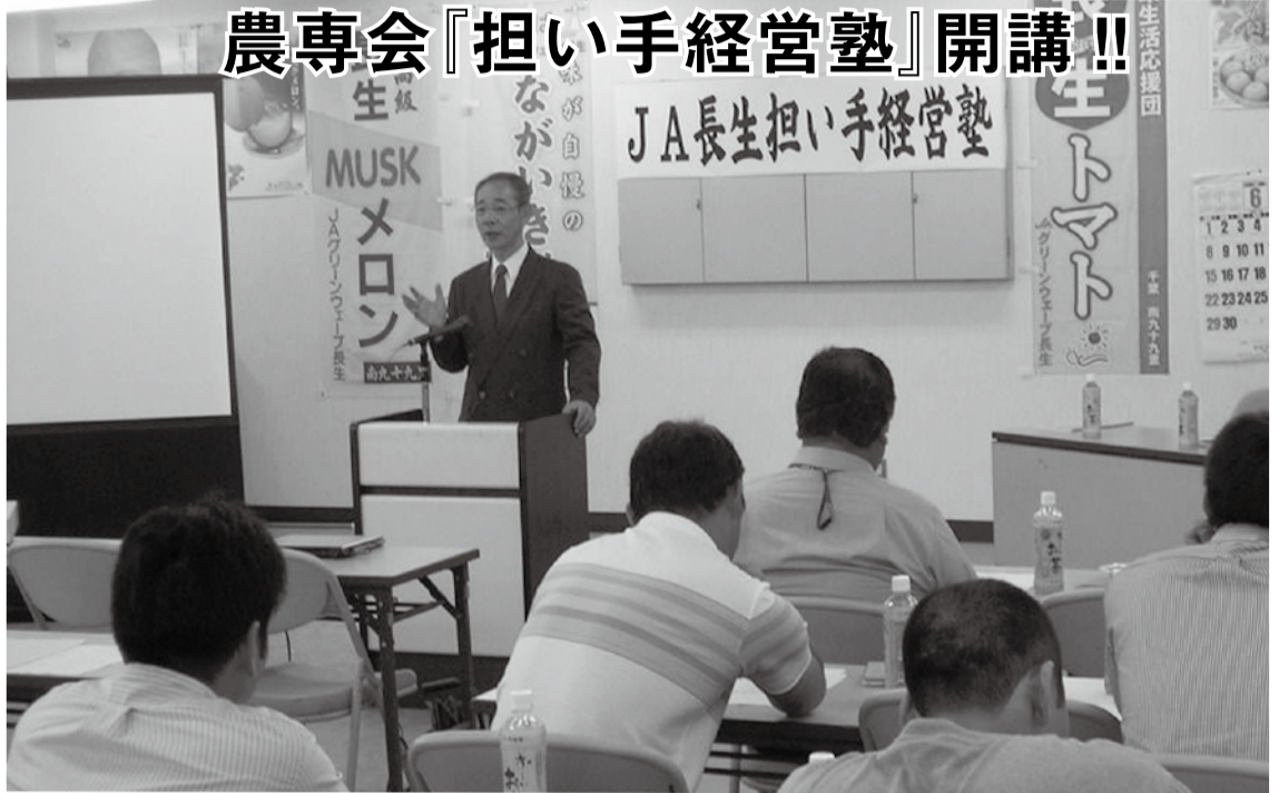
▲JA長生・担い手経営塾の開校式