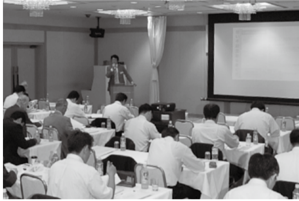
▲担い手経営塾の全国展開を確認

日本農業の発展をサポートする会計人組織「全国農業経営専門会計人協会(農専会)」はこのほど、担い手農家の総合的な経営支援を目指し、「担い手経営塾」をスタートさせた。すでに、千葉県のJA長生が同塾を採用しており、今後、農専会では同塾の全国展開を積極的に進めていく構えだ。